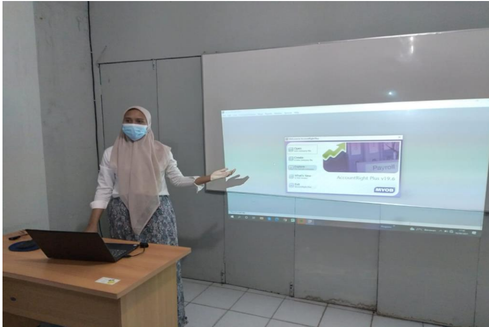
Gambar 2. Penyampaian materi tentang aplikasi MYOB untuk Siswa/I SMA Husni Thamrin Medan