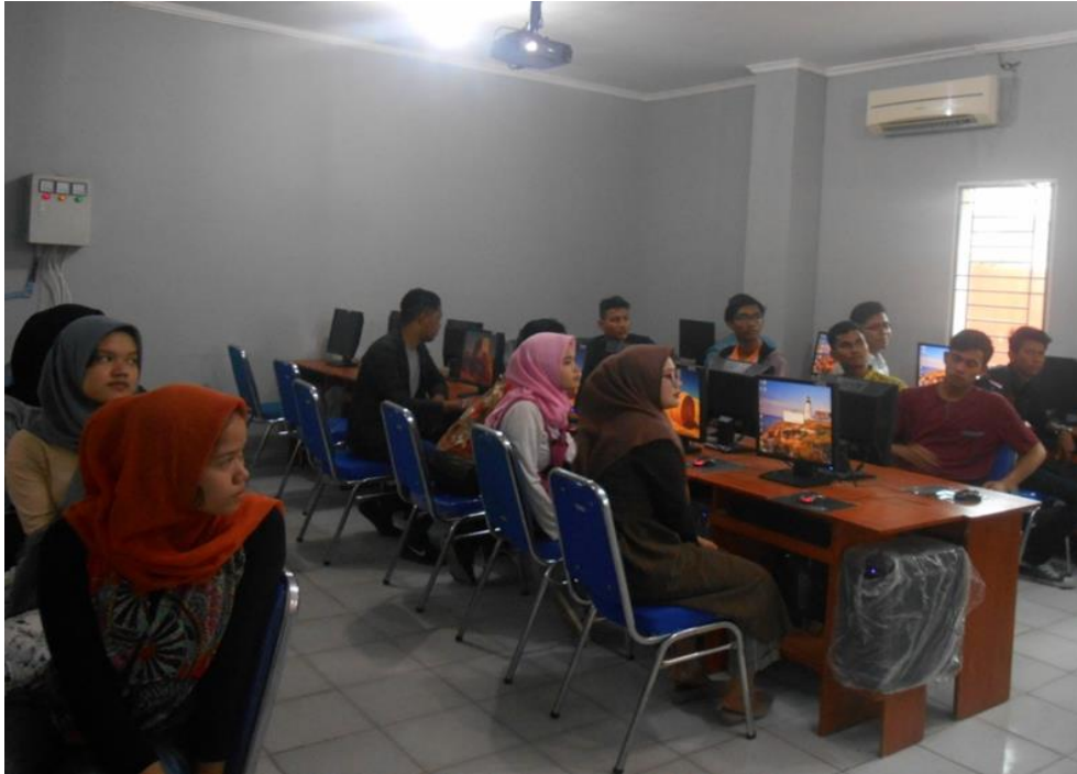
Gambar 4. Siswa/i SMA Husni Thamrin Medan mengikuti dengan sangat antusias penggunaan MYOB