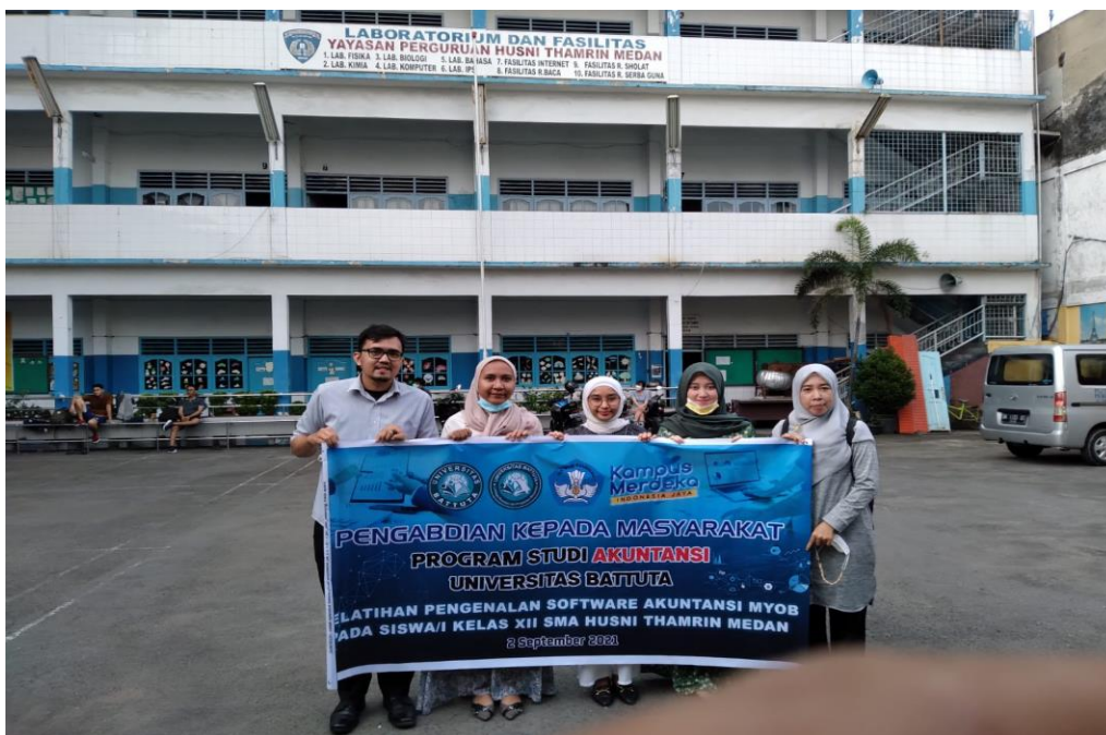
Gambar 1. Foto di depan Sekolah SMA Husni Thamrin Medan

Kegiatan Pengabdian kepada masyarakat dilaksanakan di SMA Husni Thamrin Medan. Kegiatan ini disambut dengan baik oleh Kepala Sekolah dan para civitas akademika SMA Husni Thamrin Medan tersebut. Kegiatan pengabdian ini dimulai dari persiapan: pengadaan sekaligus penggandaan modul, sosialisasi program, penentuan lokasi, waktu dan tempat kegiatan dan kegiatan inti yakni Pengenalan Software Akuntansi MYOB Pada Siswa/i Kelas XII SMA Husni Thamrin Medan. Para peserta sangat antusias dalam kegiatan ini, hal ini dibuktikan dengan peserta yang menghadiri pengabdian sebanyak 28 orang siswa/i. Dimana pengabdian hanya menargetkan 15 orang yang datang dalam kegiatan pengabdian tersebut.