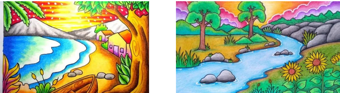
Gambar 2. Hasil Gambar Ilustrasi

Materi yang disampaikan pada kegiatan Pengabdian Kepada Masyarakat (PKM) ini yaitu mengenai bagaimana cara menggambar ilustrasi menggunakan krayon di atas media kertas dengan teknik realis.