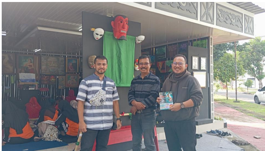
Gambar 4. Foto Bersama Pemilik Sanggar Dunia Lukis Sumatera Utara