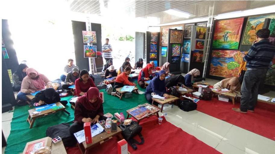
Gambar 3. Foto Pelatihan di Sanggar Dunia Lukis Sumatera Utara

Melalui Pengabdian Kepada Masyarakat (PKM) dan pelatihan dan produksi karya seni berupa pelatihan menggambar ilustrasi menggunakan krayon diatas media kertas dengan teknik realis. Kami berharap Sanggar Dunia Lukis Sumatera Utara terus mengasa kemampuan kreatifitas para peserta dalam menggambar menggambar ilustrasi menggunakan krayon agar menghasilkan karya-karya hebat untuk kedepannya dan dapat menuangkan imajinasi / hasil pemikiran kedalam media kertas ataupun kanvas.